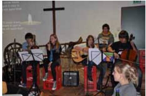
Waldgirmes und Umgebung.